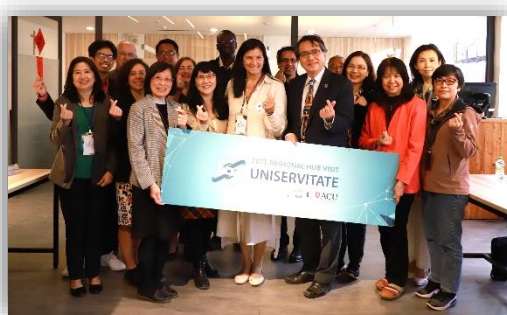
Uniservitate 和 CLAYSS 國際參訪團