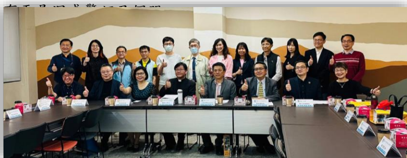
桃園振聲高中前來輔大醫學院取經

經過多年深耕，於近日開始嶄露頭角，3月中，桃園振聲高中校長率領校內各級主管及人文教師共9人前來輔大醫學院取經，同月底，10名來自 Uniservitate 及 CLAYSS (Centro Latinoamericano de Aprendizaje y Servicio Solidario)的國際參訪團在聽聞醫學院的醫學人文教