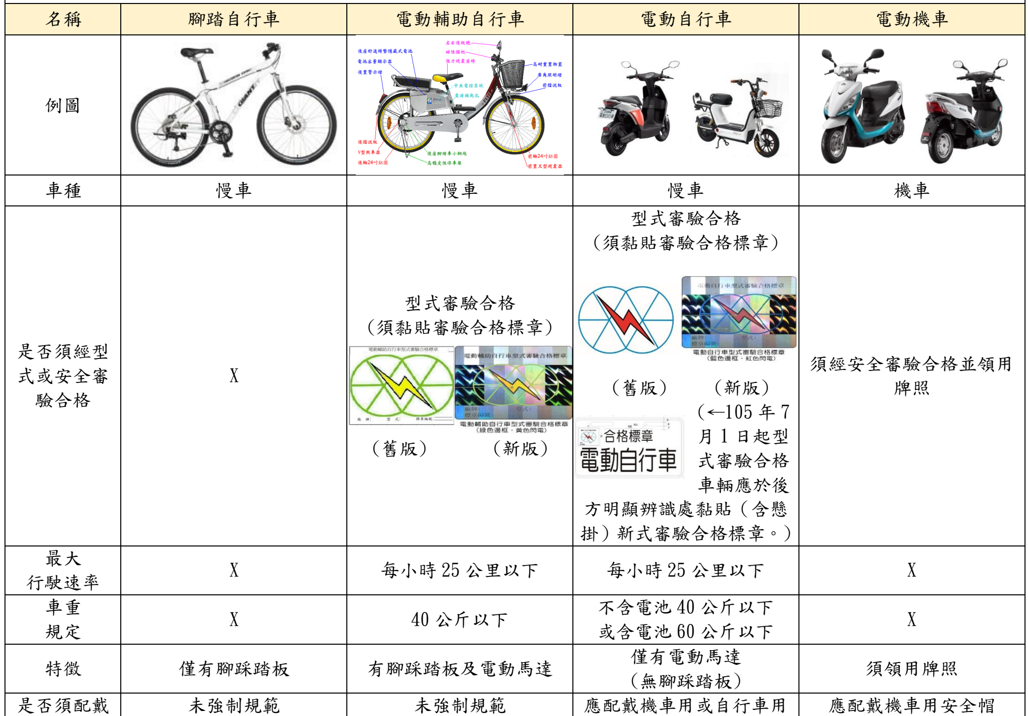
慢車(腳踏自行車、電動輔助自行車、電動自行車)及電動機車區分及重點規範彙整表