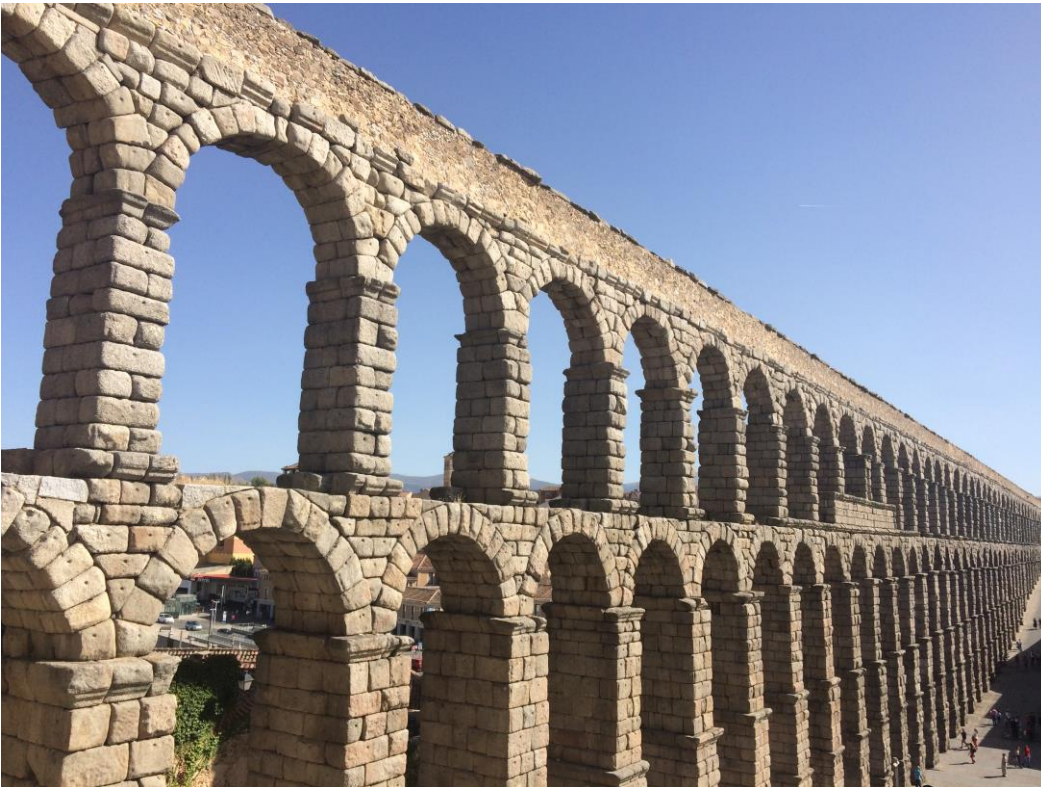
( Segovia )