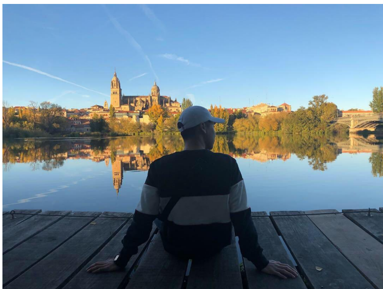
從托爾梅斯河畔往舊城區的風景