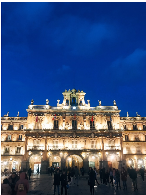
圖五、夜晚的主廣場