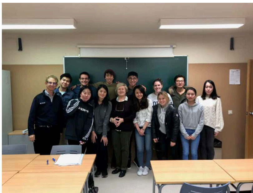
圖一、圖二 課程結束合照