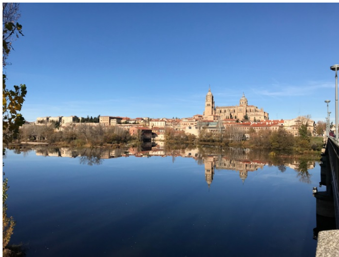
圖三、圖四 Salamanca 風景